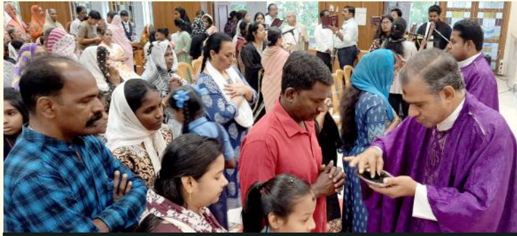
தவக்கால தொடக்க நிகழ்வான திருநீற்று புதன் (14.02.2024)