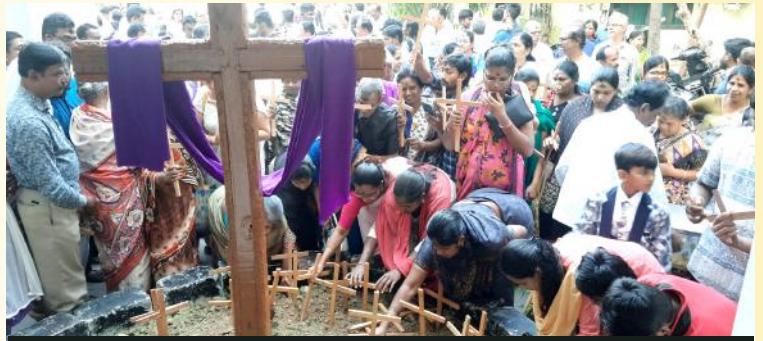
தவக்கால தொடக்க நிகழ்வில் பங்குமக்கள் (14.02.2024)