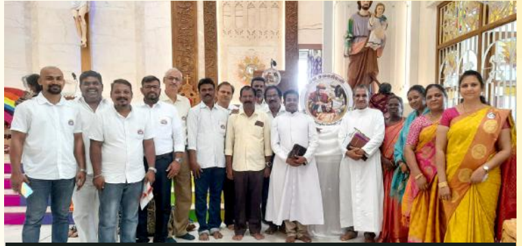
நல்ல சமாரியன் குழுவினருடன் பங்குத்தந்தையர்