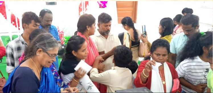
பங்குமக்கள் தங்கள் விண்ணப்பங்களை புனிதர்களின் பாதங்களில் சமர்ப்பித்தனர்.