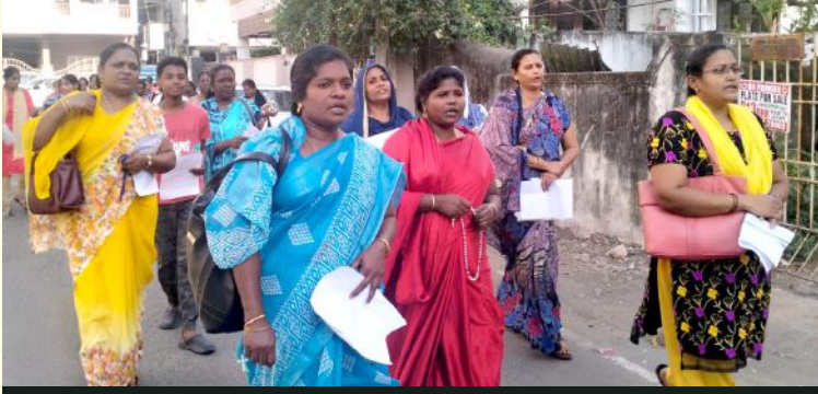
மரியாயின் சேனையினர் வழிநடத்திய சிலுவைப்பாதை (17.02.2024)