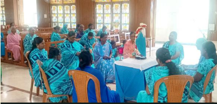
மரியாயின் சேனையினரின் ஆயிரம் மணி செபமாலை (24.02.2024)