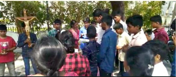
பீட்ச்சிறுவர்களின் சிலுவைப்பாதை (25.02.2024)