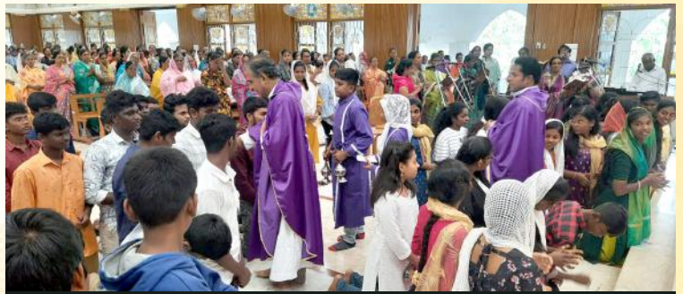
மாணவ மாணவிகளுக்கான சிறப்பு ஆசிர்வாதம் (25.02.2024)