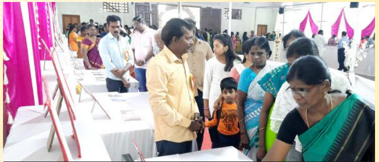
புனிதர்களின் திருப்பண்டங்கள் கண்காட்சி (25.02.2024)